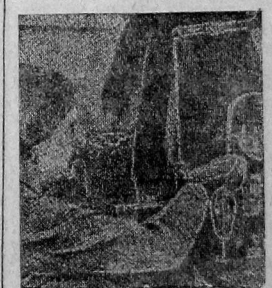
Машина-автомат для выкачивания воздуха из запаянных лампочек.

помогивают лампочки, упреленные на особые приборы. То одна, то другая из них вдруг засветится голубоватым светом вместо обычного желтоватого. Это происходит благодаря фосфору, а вместе с ним и остатком воздуха. С этого момента лампочка готова, и перед выпуском с фабрики она в числе многих других идет на проверку. Б. БАРАНОВСКИЙ.