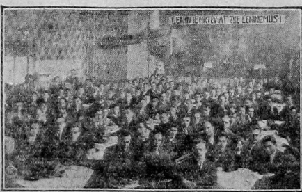
В конце января в Праге происходил съезд комсомола Чехо-Словакии. На снимке—заседание съезда. Трубит президентка оспена лозунгов: «Ленин умер—мы ленинисты».