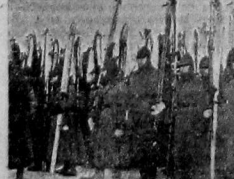
Красноармейцы-детишки на параде.

— До подразделения мастерская изготовляла ежедневно 12 пар русских сапог. А теперь то же количество рабочих изготовляет 25 пар.