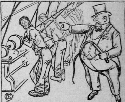
Капиталист:—Эй, вы! Имейте в виду—МНЕ придется больше платить, поэтому ВАМ придется больше работать.

С 1928 года начинаются платежи Германия по плану Дауза.