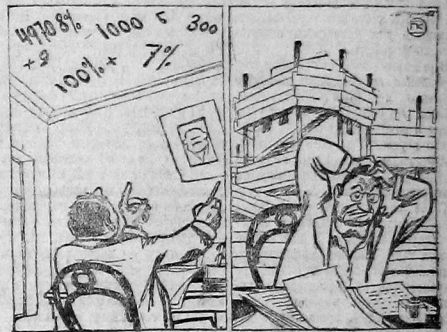
1. Смета составлена „с потолка“. 2. А нехватка ее даме на потолок.