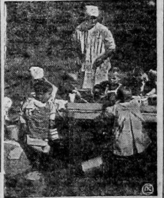
ДЕТСКИЕ ЯСЛИ. Подобных яслей в 1926 г. в нашей губернии было 57, а в 1927 г.—60; выписываемого число яслей должно увеличиться.

В дальнейшем РКК будет производить обследование выполнения директив о снижении административных расходов за полугодие. Всем руководящим учреждениям, партийным, профессиональным, комсомольским и кооперативным организациям надо применять все силы и силы, чтобы в ближайшие дни суммировать, быть опущенными полностью.