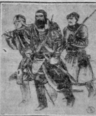
На снимке—худ. Чащинков. «Красные партизаны в Сибири» (часть картины).