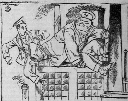
Старый спец — молодому: Куда лезешь? Здесь я сижу.

Взаимоотношения между старыми и новыми специалистами далеко не удовлетворительны. Есть случаи, когда старые спецы подпадают инициативе молодых и не дают им возможности квалифицироваться. (Из газет).