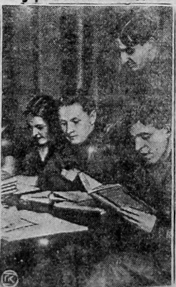
Вечерние общеобразовательные курсы, организованные на придельной ткацкой фабрике «Советская Звезда» в Ленинграде.