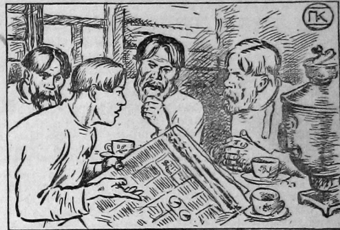
Комсомолец разъясняет односельчанам значение займа укрепления крестьянского хозяйства и задачи предстоящей посевной кампании.

МОСКВА, 4 апреля. 20 апреля в Баку назначен 5-й тираж выигрышей займа 1927 года. 5 апреля в Москве назначается 9-й тираж выигрышей займа 1924 года.