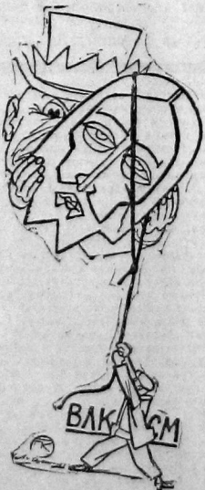
Лицо христианских социалистов.

РИМ, 12 апреля. Агентство Стэфани сообщает из Милана: «В 10 часов утра, незадолго до официального открытия Миланской ярмарки, на которое прибыл король, на площади Ювья Цезаря взорвалась адская машина. Взрывом убито 14 человек и 40 человек ранено. Несмотря на этот случай все празднества, за исключением предшествующей-галла в театре Скала, состоятся согласно намеченной программе. Полиция энергично ищет злоумышленников».