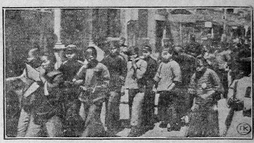
Демонстрация бастующих работниц в Китае.

БЕРЛИН, 20 апреля. Ганноверский союз металлпромышленников предложил предприятиям, в которых проводится частичная забастовка, уволить остальных рабочих. Локдаун охватывает уже 150.000 рабочих. Если бастующие не возобновят работу до утра 21 апреля, последует общий локдаун на всех предприятиях ганноверской металлургической промышленности.