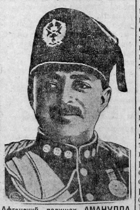
Афганский падишах АМАНУЛЛА. (К его приезде в СССР).

Закончился допрос свидетелей. Дело приняло нежелательный для польских панов оборот. ВИЛЬНО, 20 апреля. Допрос свидетелей по делу Громады закончился. Показания свидетелей защиты придали процессу политическую окраску, неожиданную и нежелательную для ее организаторов. Недовольство суда сказывалось в частом прерывании показаний этих свидетелей, которые в общем и целом давали обвинения блестящую характеристику. Их показания пролили свет на существо процесса, представляющего собой сведение счетов польской администрации с угнетаемым ею белорусским движением.