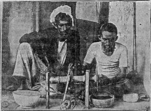
Камнеточсы на острове Цейлоне.

И все-таки, не взирая на террор, и неопушенные преследования, рабочий класс Востока все более и более сплочается в свои подпольные и легальные организации, и под руководством коммунистической партии готовит новые силы для борьбы за свое полное освобождение. П. Н.