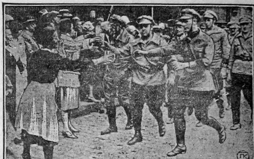
На снимке—население подносит воду красным фронтовикам во время прохождения их по городу.