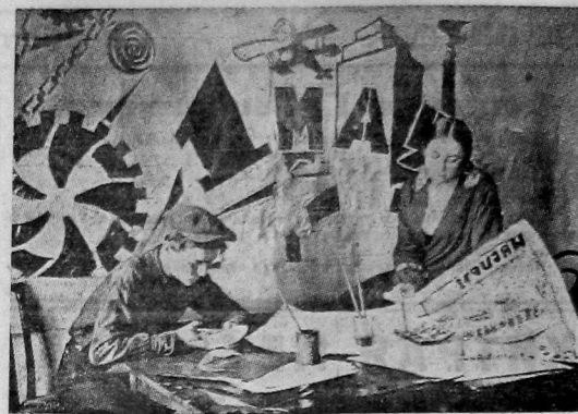
В клубе профсоюзов—подготовка к 1 мая.

водится торжественное заседание Красной армии с представителями от рабочих ТМВ, на которое приглашаются желающие члены союза ж. д. После торжественной части будет