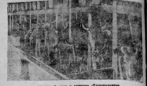
Скотный двор в совхозе «Возрождение».

Если поврежденные посевы оставлены не пересеваями, то ликвидация убытков откладывается до начала созревания с.х. растений. Во всяком случае заявлено о весенних вымоканиях и заморозках нужно сделать не позднее 1 июля, после этого срока заявления, как правило, не принимаются и страховое вознаграждение не выдается.