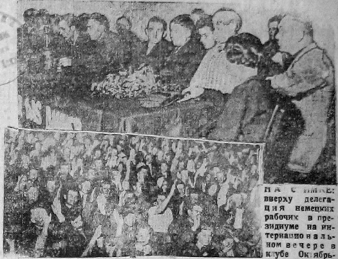
Ввиду участия вечера принимают резолюцию.

На снимке: сверху делегация немецких рабочих в преддверии интернационального вечера в клубе Октябрьской революции.