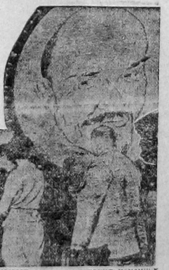
НА СНИМКЕ сверху: делегация немецких рабочих в списке клуба им. Октябрьской Революции портретом В. И. Ленина в момент исполнения Интернационала на русском языке учащими школы ФЭУ Вологодского ремонтного завода.

Об удивительных успехах навигации 1932 года, команда парохода «Соликам» выдвинула встречный. Команда приняла обязательство: увеличить ходовое время судна до 86 проц. и на 3 проц. перевысить экономию сиазовых материалов.