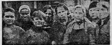
Комсомольцы ударницы, показывающие образцы примерной работы.

Ячейки колхозов „Прибой“, им. Калинина и „Строитель“ не выполняют своих обязательств.