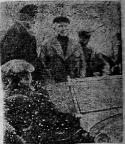
Делегация немецких рабочих направляет в союз «Молочное».