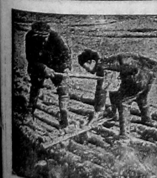
НА СНИМКЕ: ударная бригада комсомольцев за сибиркой и пропашкой Вологодской славянской запови.