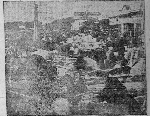
Общий вид центрального колхозного базара в Вологде.

В части же развертывания сети кооперативных ларьков решение остается невыполненным. Под кооперативную сеть отведено 36 ларь-