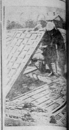
Поливка огорода на ферме Осново—ТПО 5 района.

Обработка огорода потребовала операции идет совершенно неудовлетворительно. Первую прополку следовало окончить к 1 июля, а между тем к 15 июля прополота только 62,9 проц. Вторая и третья прополка еще более затянулись. Вторая прополка на 15 июля произведена лишь на 22,5 проц., а третья—11,7 проц. Это недопустимое запоздание с прополкой грозит значительно снизить урожай овощей и картофеля.