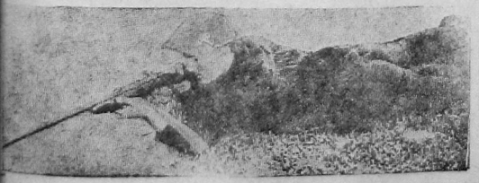
В соревнованиях охотников в стрельбе из малокалиберной винтовки первое место занял рабочий ВРЗ тов. КЛЕНИН, давший 43 попадания

ремонтированы 1518 шт. разных болтов, 6 штук крышек насосов от тормозов, краны и т. д. Несмотря на то, что из бригад вышло до 10 человек квалифицированных рабочих, бригады справляются с планом на 90—95 проц. Депо использования отходов должно получить еще более широкое распространение. Бригады должны быть усилены рабочей силой.