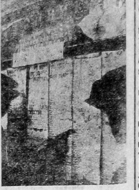
Цеховая стенгазета ВРЗ — «Вагоняно».

Большое внимание было уделено вопросам повышения качества марксистско-ленинской учебы комсомольца, работы с активом, проведения общесоюзного дня, являющегося центральными задачами комсомола.