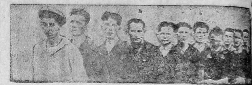
Команда пицешников гор. Одессы.