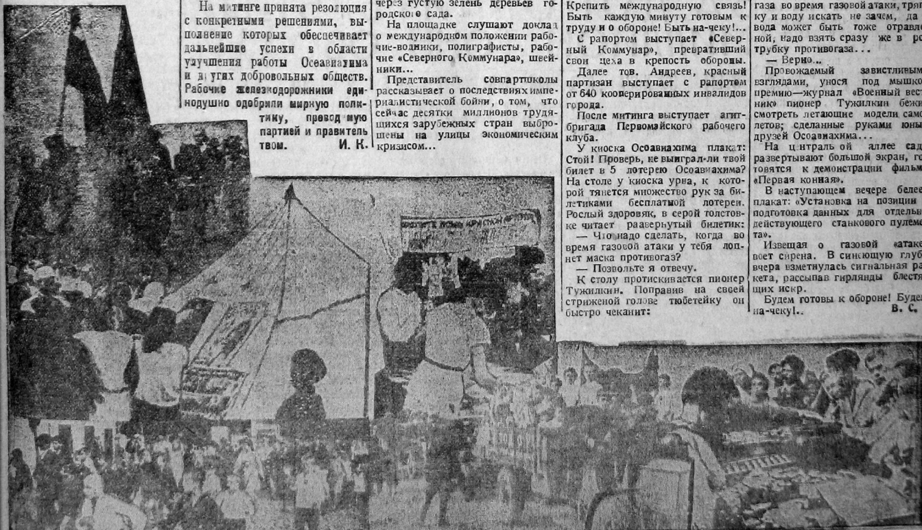
Антивоенный день в Вологде. На снимках: колонны демонстрантов направляются в сад ВРЗ.—На Красной горке у палатки РОКК выбирают книги по военизации.—Колонна Автодора в д. демонстрации.—У столов ЦРК получают печенье и бутерброды.

Будем готовы к обороне! Будем на-чеку!.. В. С.