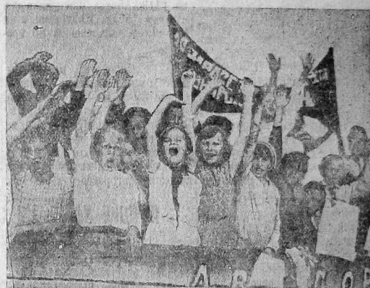
Третье поколение большевиков приветствует демонстрантов.

К антивоенному дню ВРЗ пришел с плохими производственными показателями. За 31 июля