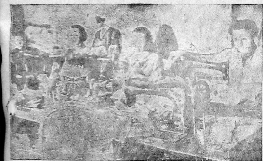
На швейной фабрике № 13 открыт цех перерабатывающий отходы производства на предметы ширпотреба. На снимке: ударницы цеха за изготовлением детской одежды.