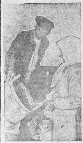
Колхозница пригорода выбирает себе галки для задела студов в магазине «Дрепмосовхоз» на колхозном базаре.

жайшему развертыванию колхозной торговли и выпуску товаров широкого потребления. А. Александров.