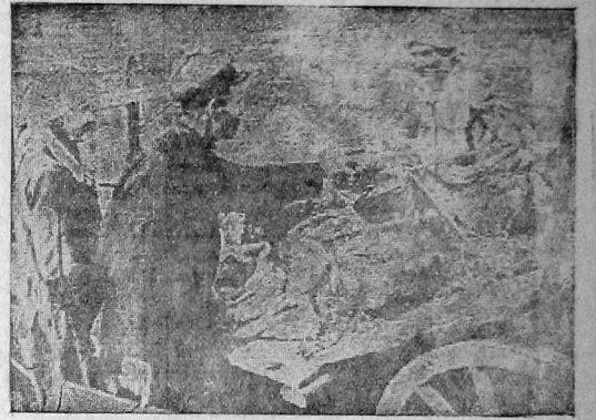
Колхозницы Кубенского района продают на колхозном базаре картофель и яблоки.