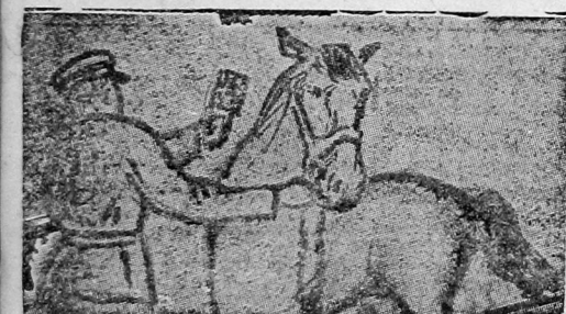
Уход за конем.

Это письмо единогласно принято на всех дивизионных и на общеполковом собраниях 10-го АРТПОЛКА. АВГУСТ 1932 г.