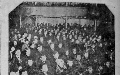
Шестою участников пленума горсовета обрели себя участники финансовой эстафеты. На снимке зал заседания.

Вместе с тем в этот план входит также задание СЗЗ за выделение средств на строительство, как это мы слышали, а также строительство отряда «Дружеский» в районе Волгодонского района. 3-й (Стальной) район и ремонт. Транспорт не выделен. Инициатором является комитет, самопроявление является самопроявление. 2-й район в среднем «архитектурный» район, который является самым активным в области.