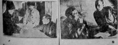
Ваша в ботке и отдала контроль в бригаде.