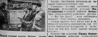
Вышла стенная газета «Ресурсы», посвященная истории и боткам.