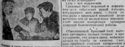
Товарищ в своем очерке изложил историю социалистической борьбы в бригаде.