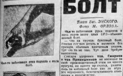
Чел-то забывает рука подала с молотком.