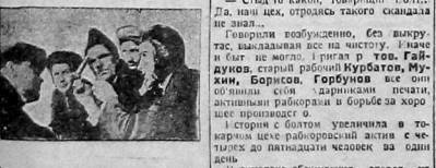
Совещание о ботке в редакции «Титаник».