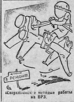
«Сверхэкономиче е методы работы на ВРЗ».

ВСЕСОЮЗНОЕ ОБЩЕСТВО «ЗА ОВЛАДЕНИЕ ТЕХНИКОЙ».