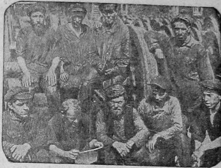
Ударики колесного цеха ВРЗ слушают чтение тезисов 17 Всесоюзной партийной конференции.

Выступлением ГУБКИНА утреннее заседание конференции заканчивается.