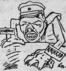
«Туда и сюда».