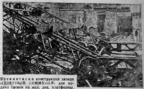
Бревенотаска конструкции завода «СЕВЕРНЫЙ КОММУНАР» для подачи бревен на жел. дор. платформы.