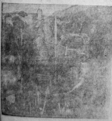
Ударная бригада в заправочной паровозной цехе ВРЗ, за подготовку паровоза к облатке.