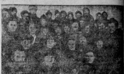
На снимке: делегаты съезда колхозников «Красная Швейцария», «Союз», «Красное Знамя», «Ударник № 2», имени Рышкова, «Босний», «Красный Луг», «Волна», «Новый Путь», «Первое Мая», имени Калинин.

Мобилизовать партийные и рабочие массы на борьбу со всякими попытками извратить марксистско-ленинскую теорию.