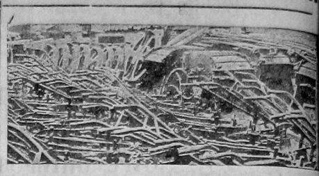
Современно заготовить сельскохозяйственный инвентарь и т. д.

(Статья перепечатывается из «Правды» от 15 марта).