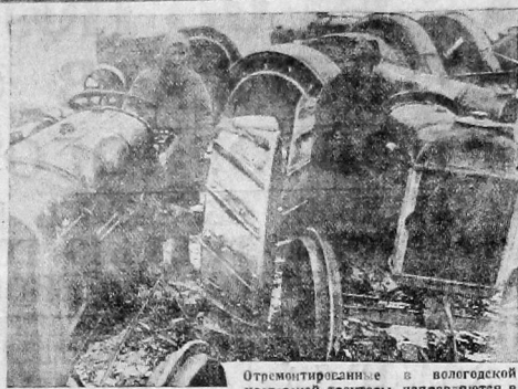
Отремонтированные в колхозской мастерской тракторы направляются в совхоз «Северная ферма».

Завтра по всему Северному краю дождется пробный выезд в поле колхозов. Этот выезд пройдет в ползунком массовой проверки фактической готовности каждой колхозной бригады к 3-й пятидневке весны. Все же колхозы готовы к выезду в поле? Вот передовые колхозы, которые готовы пахать сев: