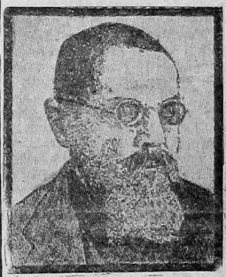
марксист и практик-революционер и вступил в ряды большевистской партии.

М. Н. Покровский родился в 1868 г. В 1891 г. он окончил Московский университет. К 1905 г. М. Н. окончательно определился как теоретик-