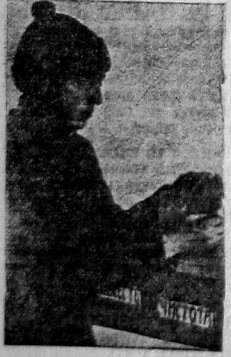
Отправка результатов анализа посевного материала в колхозы (Северобайконурский район, станция НКЗ в Вологде).