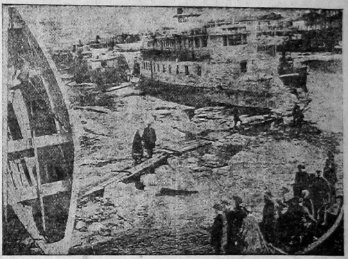
Пароходы «Добролюбов», «Волга» и «Матрос» готовы к выходу в первый рейс У пристани налажен временный перевоз для рабочих подкидок.

Окладка парохода и ряд мелких работ при участии команды на вчерашний день закончен и пароход «Достовесный» готов к выходу в первый рейс.