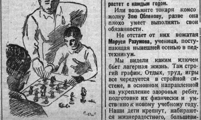
— 4А лужа сыграет еще партияку.