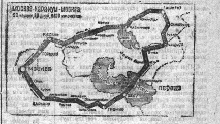
МОСКВА-КАРАУМ-МОСКВА 30 СЕНТЯБРЯ ЗАКОНЧИЛИ АВТОПРОБЕГ