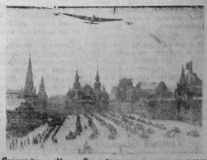
Самодет-Гатунт «Максим Горький» и колонна танков на параде

Белые, голубые, желтые, оранжевые, красные майки заполняли всю площадь... Тысячи разноцветных флажков, цветы в руках, гирлянды цветов над головами, четкий бодрый шаг, свежее солнце, звучащие по всей огромной площади в ответ на приветствия с трибун,—так победа шествует славная и радостная социалистическая весна.