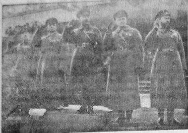
Товарищи Ворошилов, Тухачевский, Гамарник, Ягода, Егоров и Корк принимают парад на Красной площади