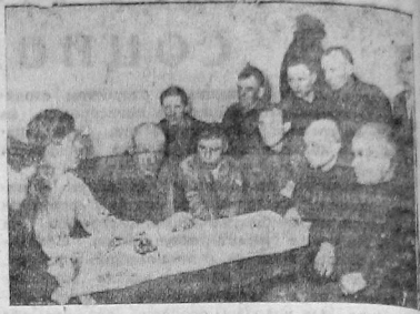
Занятие семинара рабкоров во ВПРЗ