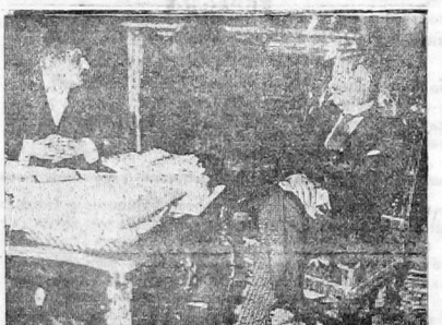
На снимке—Г-н Лаваль (слева) и тов. Потемкин