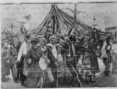
Москвичи-демонстранты на площади Свердлова

За этот короткий срок народы бывшей России из полных рабов царя и капитала, выросли в могучие свободные коллективы строителей новой социалистической жизни, 50 млн.—протариеры, колхозники, профессора, инженеры и техники, врачи, учителя, агрономы, люди науки и