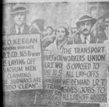
НА СНИМКЕ: Пикеты бастующих служащих Нью-Йорка митинговали с плакатами, протестующими против увольнения их товарищей.