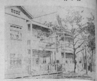
Погребный трестом «Севертранс» новый дом на ул. Лесная для своих сотрудников