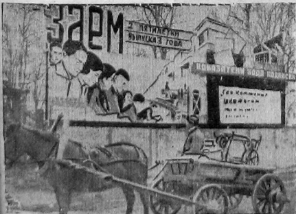
Колхозники Красной горки тов. В. Лысов купил швейную машину и возвратился домой, остановился у витрины-плаката о ходе подписки на заем

До сегодняшнего дня МТС не получала от крайЗУ разнарядок на горючее, тракторы работают на старом запасе. К 5 мая разрядка должна была поступить обязательно. Прошло еще 4 дня, а МТС еще только собирается заняться по этому вопросу с крайЗУ.