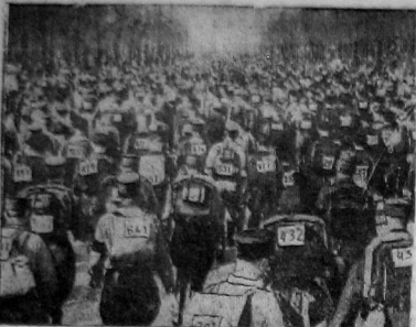
В Германии состоялся своеобразный состязание на выносливость: 900 штурмовиков должны были пройти 35-километровую дистанцию с нагрузкой в 25 килограммов.

После окончания беседы делегаты устроили товарищу Калининну горячую овацию.