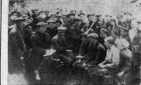
Матинг в токарном цехе завода «Северный коммунар» о подписке на новый заем