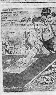
Должники сельхозбанка возвращены колхозам. Колхозники благодарят государство за помощь в ликвидации задолженности.

Многочисленные постановления общих собраний колхозников, посвященных снятию задолженности и возврату обязательств сельхозбанком, свидетельствуют об исключительном покое, с которым колхозные массы встретили это решение партии и правительства. Красной нитью через все эти поста-