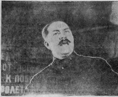
Выступление тов. Кагановича 14 мая в Колонном зале Дома союзов на торжественном заседании, посвященном пуску метро.

Крестьянин, рабочий умеет видеть в метрополитене, в этих отниках, в этих мраморных колоннах не только мрамор, но только прекрасное техническое сооружение. Он видит в метро воплощение своей силы, своей власти. Раньше только помещики, только богачи пользовались мрамором, а теперь власть наша, эта стройка—для нас—рабочих и крестьян,