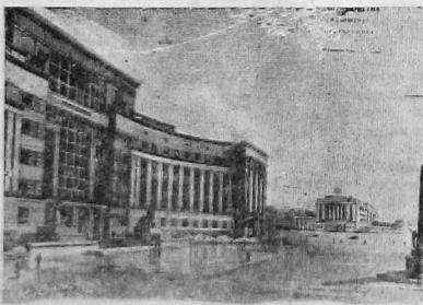
На архитектурной выставке в Новосибирске представлены работы архитекторов Новосибирска, Иркутска и других городов Сибири. На снимке: проект Дома советов в г. Иркутске — работа профессора Кичева.

Лучшие ударники ЦАГИ, гражданского воздушного флота, представители общественных организаций в строгом молчании отдадут последний долг погибшим.