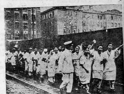
На снимке: демонстрация бастующих рабочих в Токио требующих повышения зарплаты.

Центральный комитет коммунистической партии Германии