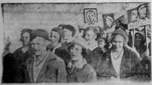
Колхозники на деревне Прокукино направляются на общее собрание колхоза «Верный путь», посвященное утверждению нового устава.