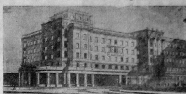
В Ленинграде на проспекте 25 Октября будет встроено дом для инвалидов с объемом в 15000 кубометров.