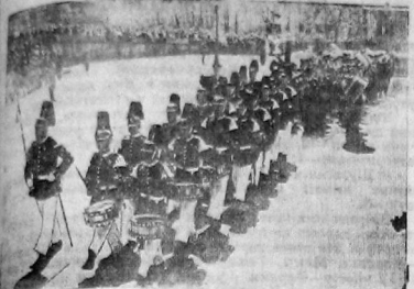
На снимке: парад бывших гвардейцев в их прежней каскаковой форме на улицах Берлина.