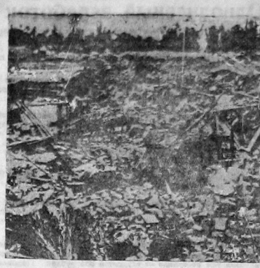
21 апреля на острове Формоза произошло землетрясение, повлекшее за собой огромное количество жертв (3000 убитых и 11000 раненых). Погибали тысячи домов были разрушены полностью, а 23000—частично.

На снимке: одна из улиц города Тобуи после землетрясения.