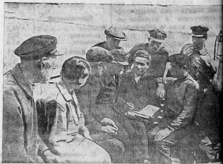
Полит- и техникуму широко развернули с первого же рейса на ветровозе "Сталинец", рейсующем по Волге, между Астраханью и Сталинградом. Во время первого рейса проводимы были 1 политзанятие и 2 занятия по техникуму. Во время стоянки в Сталинграде—еще одно занятие по техникуму и одно политзанятие с участием беспартийных на тему об изучении истории партии.