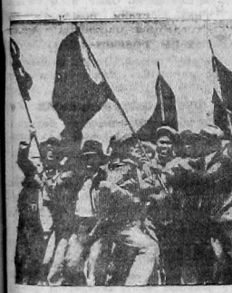
На сцимине: первоймаявская рабочая демонстрация в токийском Шета-парке.