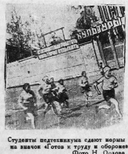
Студенты педагогического института в вачах «Готов к труду и обороне»