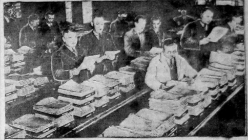
На снимке: Служащие международной избирательной комиссии составляют избирательные списки в здании городского самоуправления в Саарбрюкене.