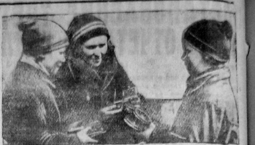
Комсомольская группа в Жалнин (вмочая бредня вагонного цеха) формируют первополки, продукцию вывозит за счет качества. На снимке: группа тов. Жалнин и старший слесарь по группе т. Кошаратова проверяют перед сдачей на вагон качество ремонта пути и колес.

Советские и хозяйственные организации должны сосредоточить особое внимание на обеспечении плана перевозок жел. дор. транспортом, выполнении им всех качественных показателей, решительно при этом бороться с остатками недисциплинированности и разглазды-