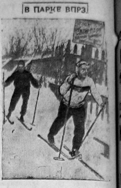
Работе ВРЗ на большой тренировке