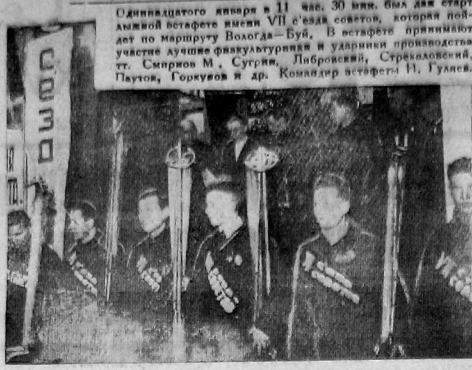
На снимке: участники съездов по торжественному восседанию перед отправкой в путь.