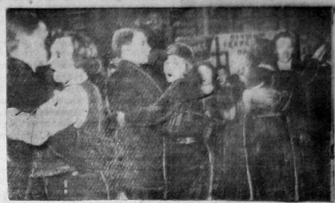
Пятого января состоялся вечер ударников ПРЗ. После торжественного заседания были организованы массовые игры и танцы. На снимке — молодцы ПРЗ задуэт