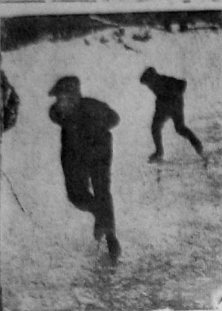
Ученики средней школы № 7 Ковелева в Иваново тренируются в городском школьном колесоходном соревновании