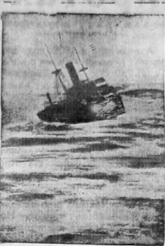
На снимке: Момент гибели английского судна «Эсфорт», утонувшего в Атлантическом океане во время шторма. Из состава команды 9 человек удалось спасти, 17 погибла.