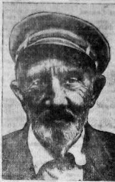
Почетный член академии наук И. В. МИЧУРИН

Мичуринск в трауре. На улицах вывешены флаги, объявлено трауром. С утра в домах предприятий города сожжены траурные митинги. Колхозы, сельско-хозяйственные исследовательские институты, вузы берут на себя обязательство продолжить дело