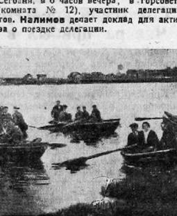
Актив туристов Вологды перед отправкой на экскурсию на лодках