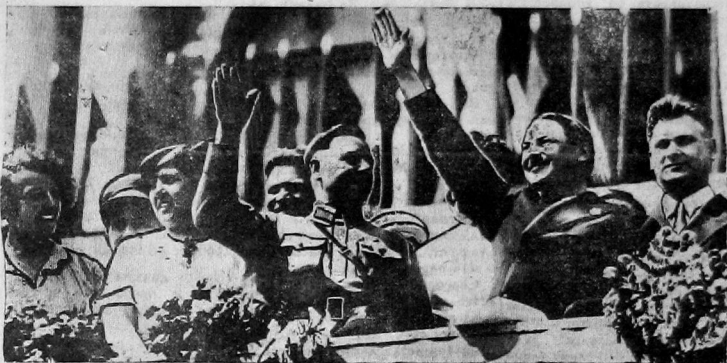
Парад ленинградских физкультурников. На снимке: тт. Ворошилов, Жданов, Калинин и др. приветствуют с трибуны физкультурников.