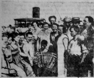
18 июня рабочие ремонтного завода провели массовую прогулку за город. На снимке — агитбригада исполняет песенку по случаю