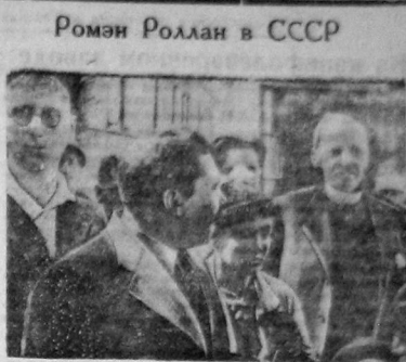
На сцене: втроем Ромэн Роллан на Белорусско-Валтиском вокзале. Крайний справа Ромэн Роллан, район его могила, в Ароов и С. Третьяков.

РИМ, 25 июня. Сегодня в помещении полпредства СССР в Риме полпред СССР в Италии, Штейн и посланник Колумбии и Италии г-н Турбаи обменялись нотами об установлении нормальных дипломатических и консульских отношений между Советским Союзом и Колумбией. (Колумбия—республика, расположенная в северо-западной части Южной Америки). По переписи 1926 года ее население составило 7,8 млн. человек).