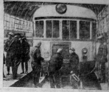
Службаля быстроходная автомоторная АД-2, изобретенная Калужским заводом НКПС совершила первый рейс и была осмотрена на Киевском вокзале Зав. и. д. в Москве.

ВАРШАВА. В Варшаве бастует около 30000 рабочих. Бастуют металлисты, рабочие обрабатывающей промышленности. В Лодзи бастует около 80 процентов рабочих. Забастовка носит политический характер и направлена против фашизма и нового избирательного закона.