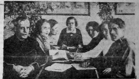
Занятие кандидатской партийной школы при парторганизации горно

ЦК ВКП(б) обязывает секретарей райкомов и горкомов ВКП(б) немедленно отвечать на запросы секретарей других райкомов и горкомов, связанные с проверкой партдокументов, и тем самым затрудняя проверку подлинности партийных документов и выявление в связи с этим, принадлежат ли действительно партийлет тому лицу, которое