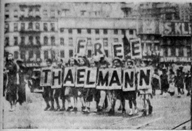
30 мая в Нью-Йорке состоялся парад и демонстрация в честь национального юбилейного дня. Массовый митинг, предшествовавший параду, собрал в Мэдисон Сквер огромное количество демонстрантов. Всеми за ораторами демонстранты поклонились восточней борьбу против войны и фашистского рабства.