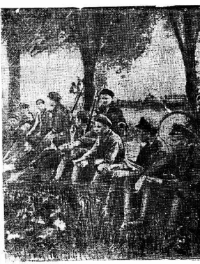
Лагерный сбор Осованинхима. Последний привал.

Быстро отходят по казанию. Занимаем свои позиции. Наскоро маскируемся. Шелкают затворы.