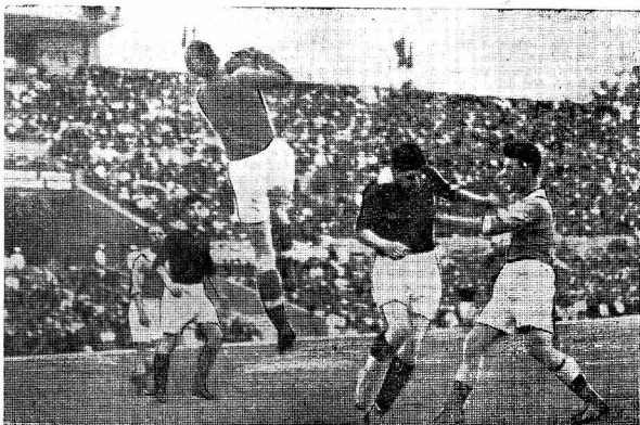
3 июля в Москве на стадионе «Динамо» состоялся футбольный матч между сборной футбольной командой Москвы и сборной Норвежского рабочего спортивного союза. Игра закончилась со счетом 3:1 в пользу Москвы. На снимке: момент игры.