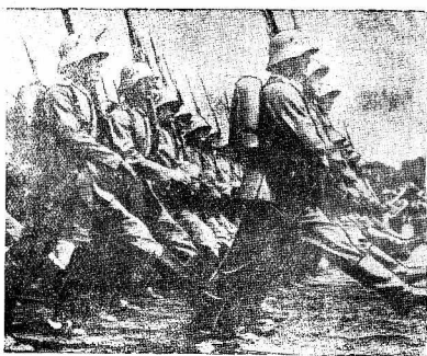
На снимке: очередной военный парад в Берлине 15 июня