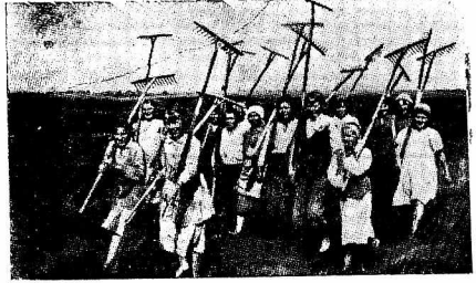
На участках пригородного хозяйства завода «Северный коммунар» идет сеноуборка. На снимке: бригада Кузнец направляется на работы в поле.