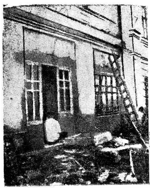
Бывший склад на площади Соколы артепкооп переоборудует в культурный университет, на подобие университета на Киевском мосту. Новый университет откроется первого августа. Что будет в университете? Готовое платье, обувь, галантерея, парфюмерия, головные уборы, хозяйственные товары. Университет будет иметь два больших отделения. На переоборудование затрачено около трех тысяч рублей. На снимке: ремонт университета.

Шубейкин, пред. правления промкооп. Степин, врач.