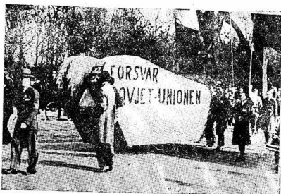
На снимке: макет танка с лозунгом: «Защитать Советский Союз», на первомайской демонстрации в Копенгагене.