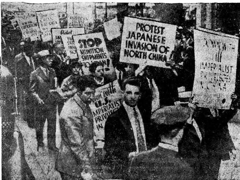
20 июля американское общество «Друзей китайского народа» организовало демонстрацию протеста против действий Японии в Китае. Демонстранты подали к японскому консульству с требованием немедленно отозвать японские суда из Китая.

На утреннем заседании присутствовал популярнейший пролетарский писатель А. Барбюс. Его появление было тепло встречено делегатами.