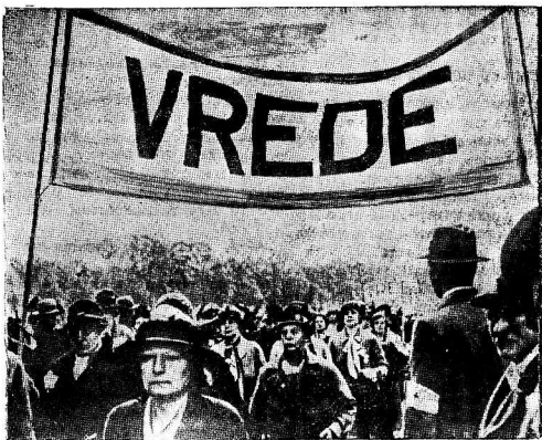
На снимке: антивоенная женская демонстрация в Гаге (Боландия), состоявшаяся в день 36-летия съезда первой мирной конференции в Гааге. На плакатах—слово «Мир».