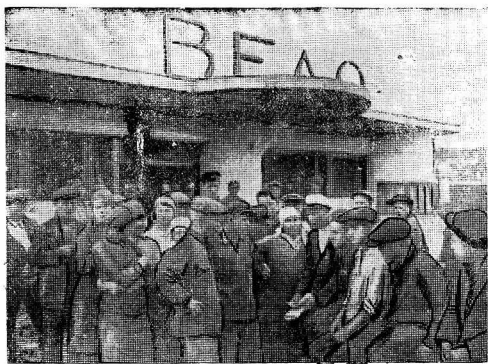
Рабочие завода «Северный коммунар» 1 августа в обеденный перерыв слушают беседу об антиволокном дне. Беседа проводится на площадке у павильона, где расположены: вело-гараж, буфет и читальня.